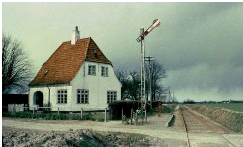
Ledvogterhuset ved Branderslev – Fra Nakskov-Kragensbanen I drift 1915 til 1967.

Nakskov Ladegård er brændt, alle pigerne er rendt, udi byen bor de nu, alle karlene til gru